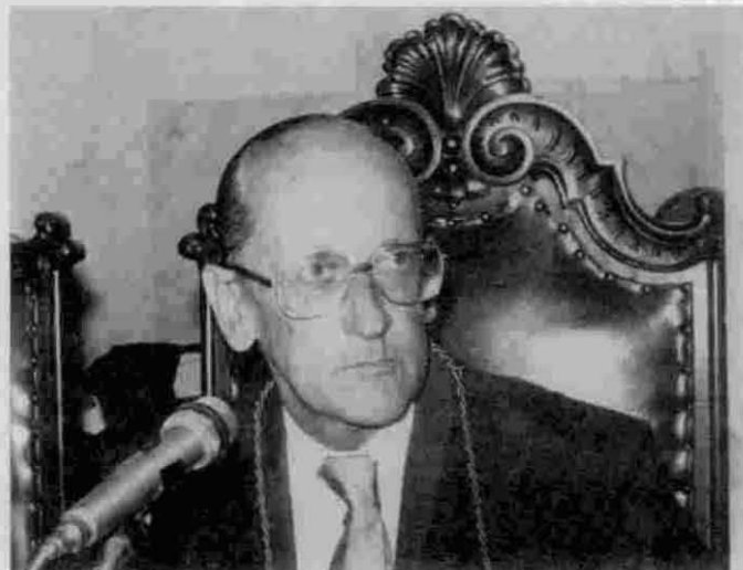
Conselheiro João Féder: "O orçamento é elemento substancial do controle do Estado".

O encerramento foi marcado com palestra da Presidente do Tribunal de Contas da União, Ministra Élvia Lordello Castelo Branco.