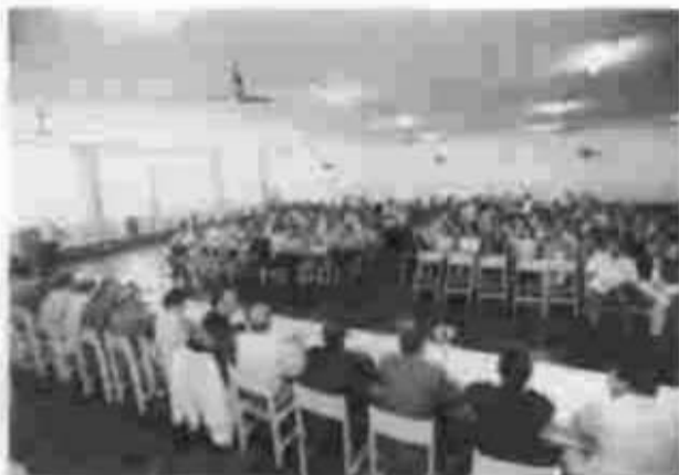
Encontro sobre as emendas 19 e 20 da Constituição foi dos mais prestigiados, em Astorga.

Durante o mês de julho o seminário foi realizado em Jacarezinho, União da Vitória e Campo Mourão. Os técnicos do Tribunal falaram de temas específicos da atuação das entidades sociais, analisando assuntos relacionados às cláusulas de convênios, objetivos determinados, prazos de vigência, atribuições da entidade, atribuições do órgão repassador, empenhos e liquidações, repasses, abertura de contas bancárias, documentos de despesas, obras - construção e ampliação, controle interno, guarda de documentação e prestação de contas. O assunto foi discutido ainda nas cidades de Paranaguá, Ponta Grossa, Cianorte, Clevelândia e Toledo.