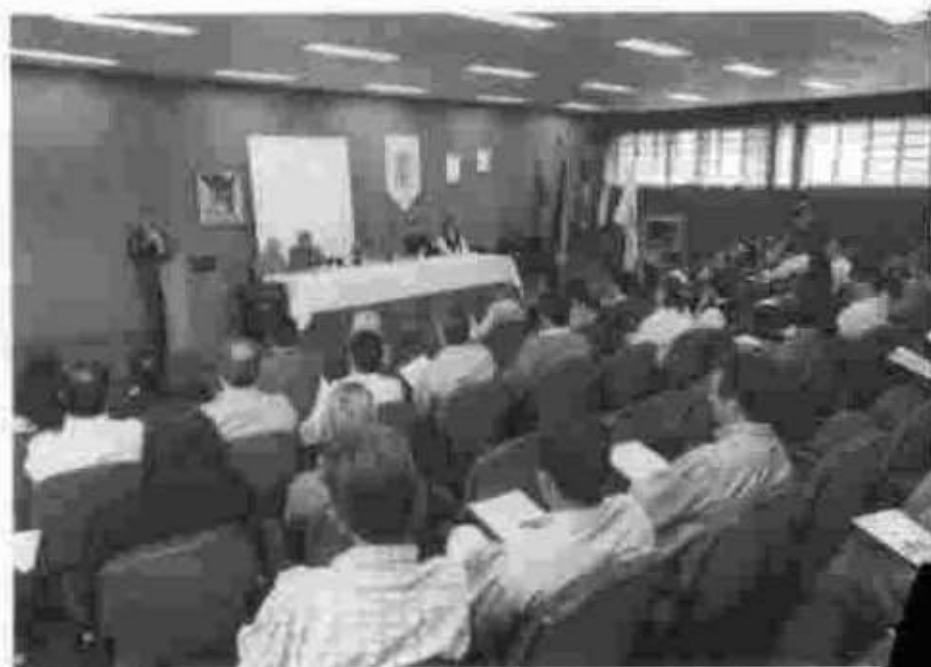
Municípios da Região Metropolitana de Curitiba e do litoral participaram de encontro em São José dos Pinhais.

No mês de junho, em Cascavel, 244 entidades sociais da região compareceram ao seminário técnico sobre prestação de contas de convênios, auxílios e subvenções sociais.