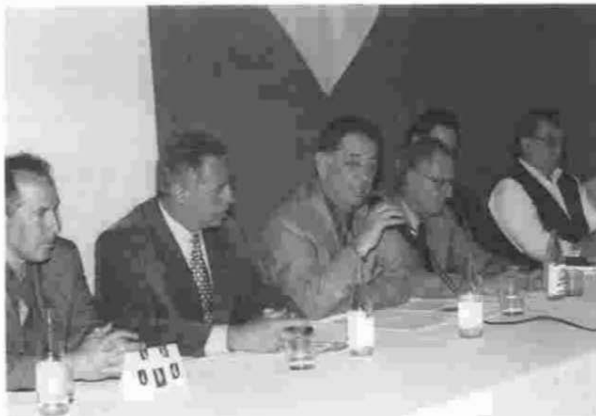
O presidente Quielise Crisóstomo da Silva fez a abertura de todos os seminários externos promovidos pelo TC.

Ao longo de 1999 o Tribunal de Contas promoveu mais de 50 encontros, entre seminários e cursos externos e internos. A política de descentralização implementada pelo presidente conselheiro Quielise Crisóstomo da Silva levou informações e esclareceu dúvidas de prefeituras de todo o Estado. Incluindo os seminários e cursos internos, o Tribunal realizou uma média de um evento por semana, contabiliza o presidente do TC, Quielise Crisóstomo da Silva, que durante 99 defendeu e aplicou uma gestão baseada na antecipação a eventuais erros na aplicação dos recursos públicos, denominada de "profilaxia do mal". Os 399 municípios paranaenses foram atingidos pelo seminário que abordou os aspectos técnicos e legais da prestação de contas. O encontro tiveram como sede as cidades de Matinhos, Colorado, Santo Antônio da Platina, Assaí, Janiópolis, Foz do Iguaçu, Pato Branco e Pitanga. Para o presidente do Tribunal de Contas, com esta prática de descentralização todos ganham: os administradores públicos, que evitam cometer erros; o TC, que racionaliza seu trabalho; o governo, que vê os recursos serem aplicados de forma correta e, especialmente, a população, que tem a certeza de que o dinheiro dos impostos