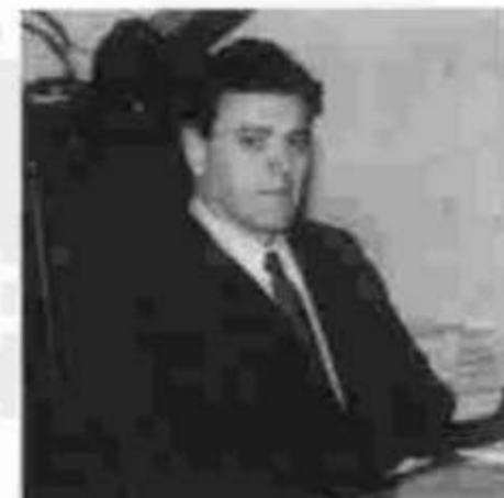
Edgar Chiuratto Guimarães, diretor geral do Tribunal de Contas.

A prestação de contas, que é determinada pelo artigo 75 da Constituição Estadual, recebeu parecer prévio que foi encaminhado à Assembleia Legislativa para análise e votação em plenário.